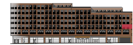
Ansicht Fuhsbüttler Straße